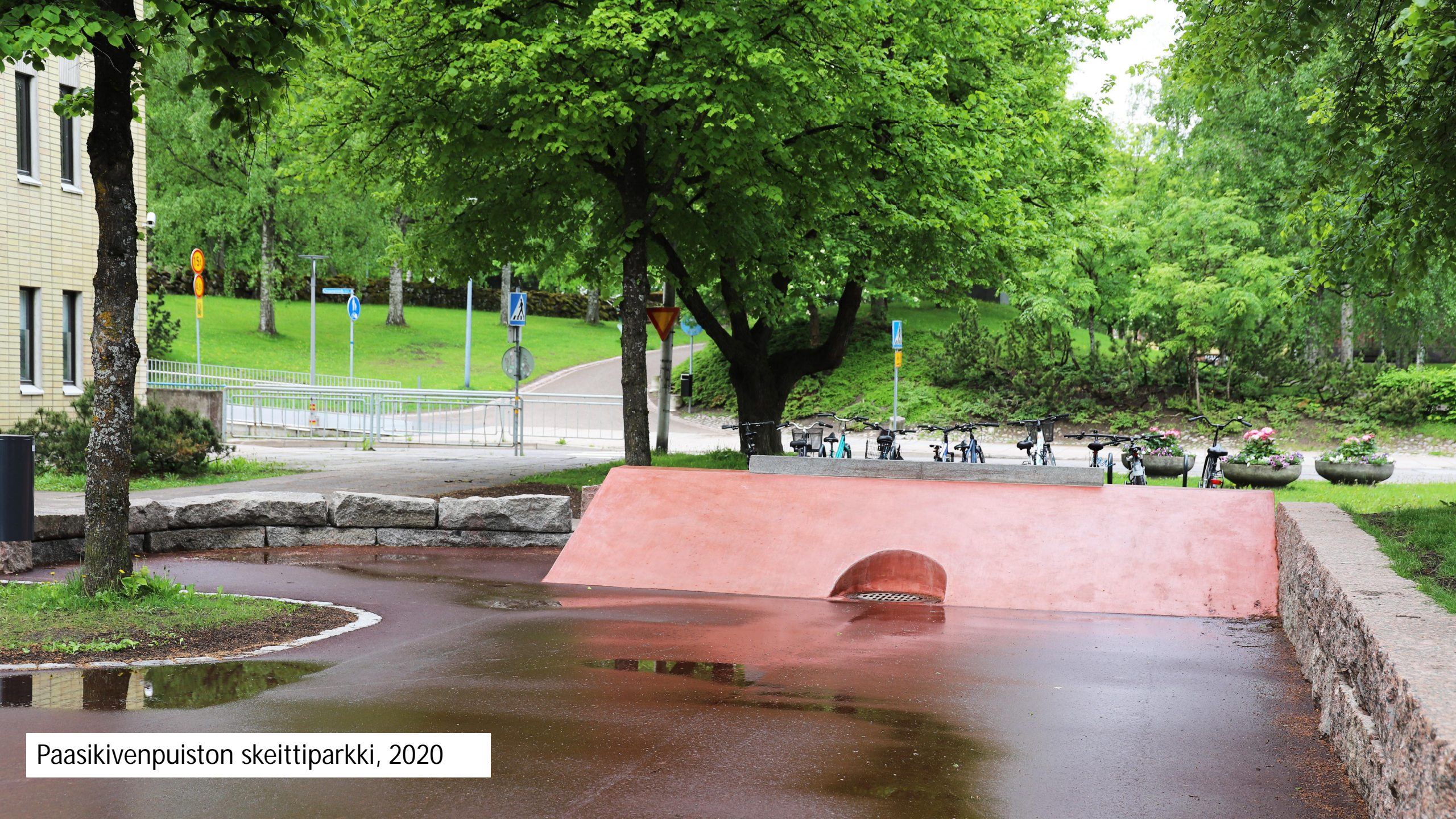
Paasikivenpuiston skeittiparkki, 2020