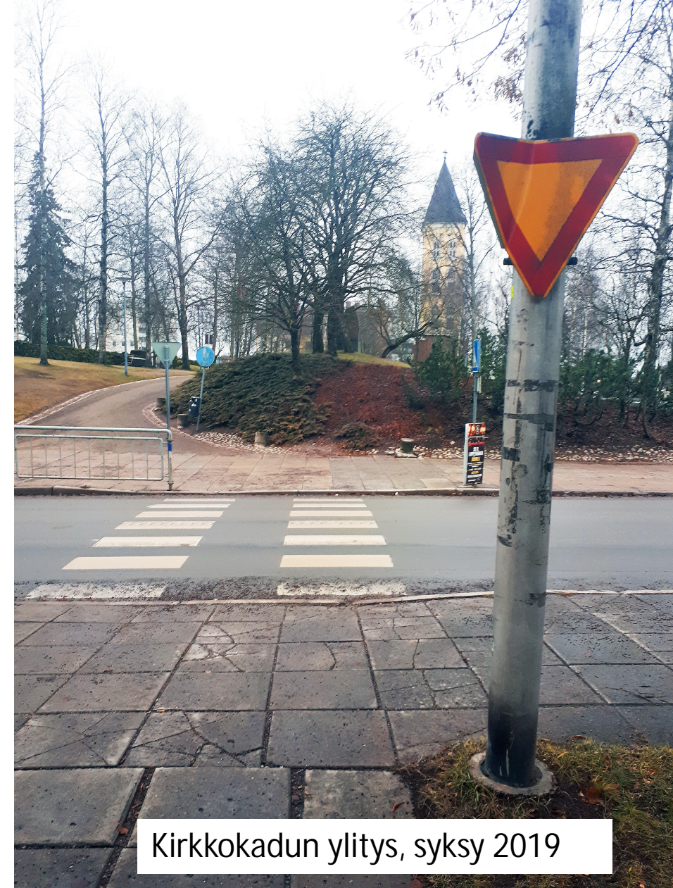
Kirkkokadun ylitys, syksy 2019